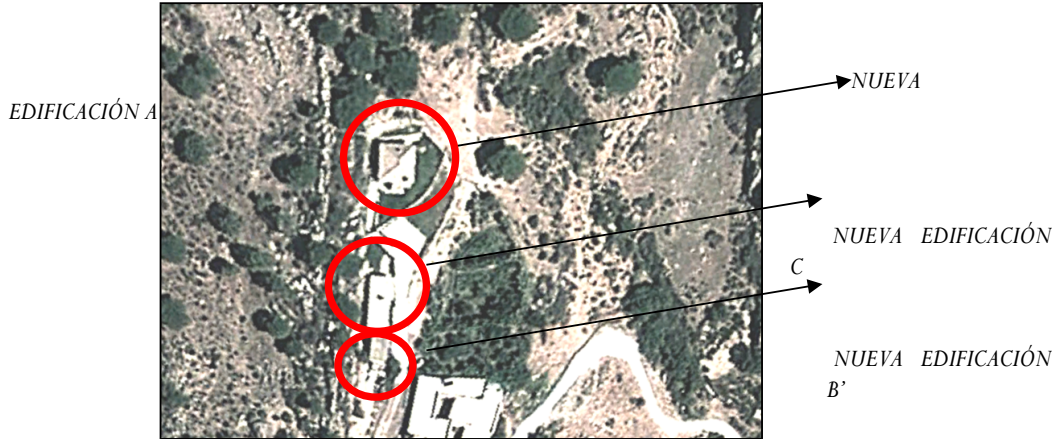
Vuelo año 2012

-Que la segunda edificación primitivas (B), ha desaparecido y se visualiza una nueva edificación (B'), tipología vivienda unifamiliar aislada con una superficie construida estimada de planta de 45m 2 .